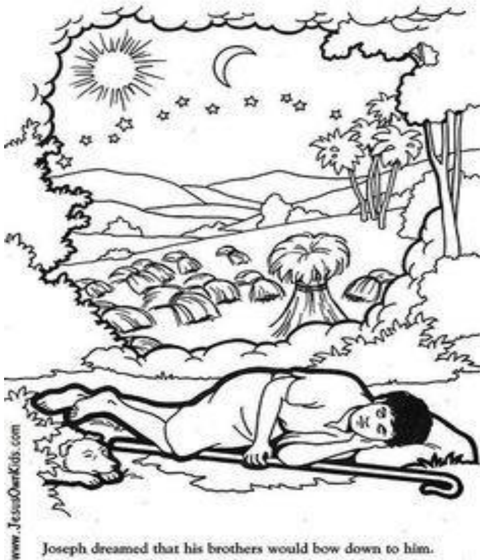
Joseph dreamed that his brothers would bow down to him.

यूसुफ ने स्वप्न देखा कि उसके भाई भूमि पर गिरकर उसे दण्डवत् करेंगे।